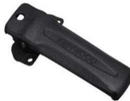
KBH-21 [W] CLIP PER CINTURA (LUNGA, 50mm)