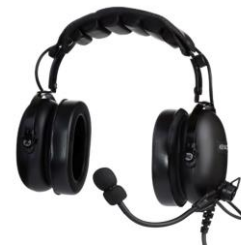
KHS-10-OH-SD CUFFIA BIAURALE PROFESSIONALE CON MICROFONO A LABBRO