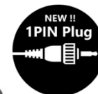
Nuovo connettore a 1 pin per microfono parla/ascolta Compatibile con ProTalk FD WD-K10srs