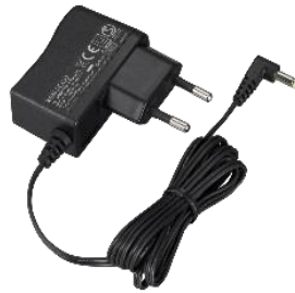
KSC-44SL [E] ADATTATORE AC (PER L'USO CON KSC-50CR)