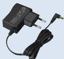
KSC-44SL [E] Adattatore AC (per l'uso con KSC-50CR)