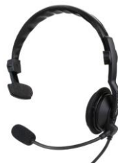
KHS-7A-SD CUFFIA MONO AURALE CON MICROFONO A LABBRO