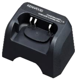
KSC-50CRB [W] BASE DI RICARICA