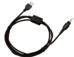
KPG-186U [W] CAVO PER PROGRAMMAZIONE