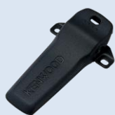
KBH-14 [M] Clip per cintura (corta)