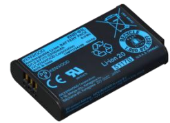
KNB-81L [W] BATTERIA RICARICABILE Li-ion (3.6 V/2200 mAh)