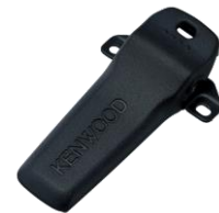
KBH-14 [M] CLIP PER CINTURA (corta)