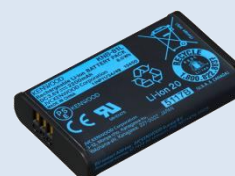
KNB-81L [W] Batteria ricaricabile Li-ion (3.6V/2200mAh)