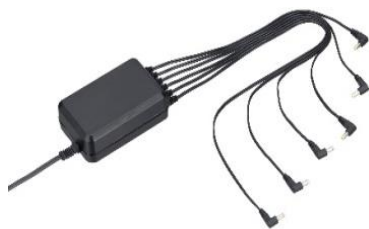
KSC-44ML [M] ADATTATORE AC (PER L'USO CON PIÙ UNITÀ, FINO A SEI, KSC-50CR)