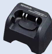
KSC-50CRB [W] Base di ricarica per batteria