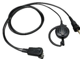
EMC-14 [W] MICROFONO A CLIP CON AURICOLARE