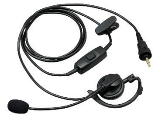
KHS-37 [W] MICROFONO A LABBRO CON AURICOLARE DA ORECCHIO ESTERNO