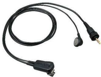
EMC-13 [W] MICROFONO A CLIP CON AURICOLARE