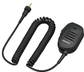
KMC-55 [W] MICROFONO PARLA/ASCOLTA (IP54/55/67, tasto PF, Jack 2,5 D EP)